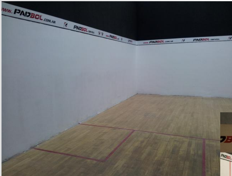
ELCHE SQUASH CLUB

TRANSFORMACION PISTA DE SQUASH 100% A PADBOL SIN NECESIDAD DE OBRAS.